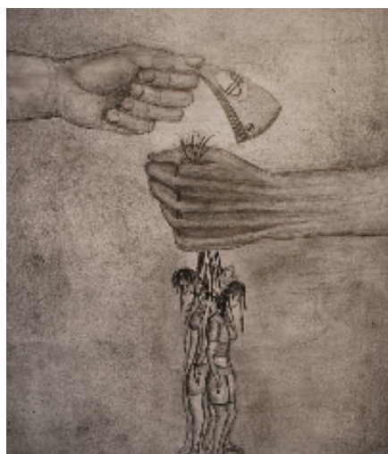
Lucrare premiata cu locul I la concursul de desene "Si eu lupt impotriva sclaviei moderne"

„E bine că tinerii sunt informați”, a mai adăugat aceasta, „însă există între ei încă un număr mare care cred ca traficul de persoane nu este o amenințare serioasă, că lucrurile nu se întâmplă în imediata lor vecinătate, ceea ce demonstrează nevoia de a continua aceste campanii de informare”.